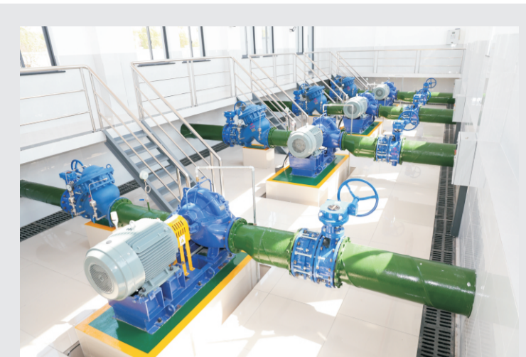
近日，岑河农场供水加压站的成功并网运行，荆州经开区企业的用水难题得到彻底解决。

荆州市内部资料准印证第 36 号 2025年3月31日 星期一 总第256期 地址：荆州市南湖路9号 电话：0716-4309982 E-mail:jsjtqdb@163.com