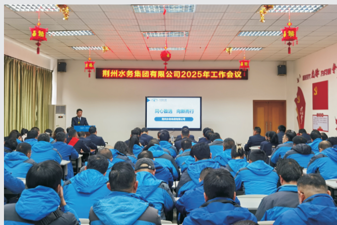
2月14日，荆州水务集团有限公司召开2025年度工作会议，全面总结2024年的工作成果，并谋划部署2025年目标任务。

荆州市内部资料准印证第36号 2025年2月28日 星期五 总第255期 地址：荆州市南湖路9号 电话：0716-4309982 E-mail:jsjtqdb@163.com