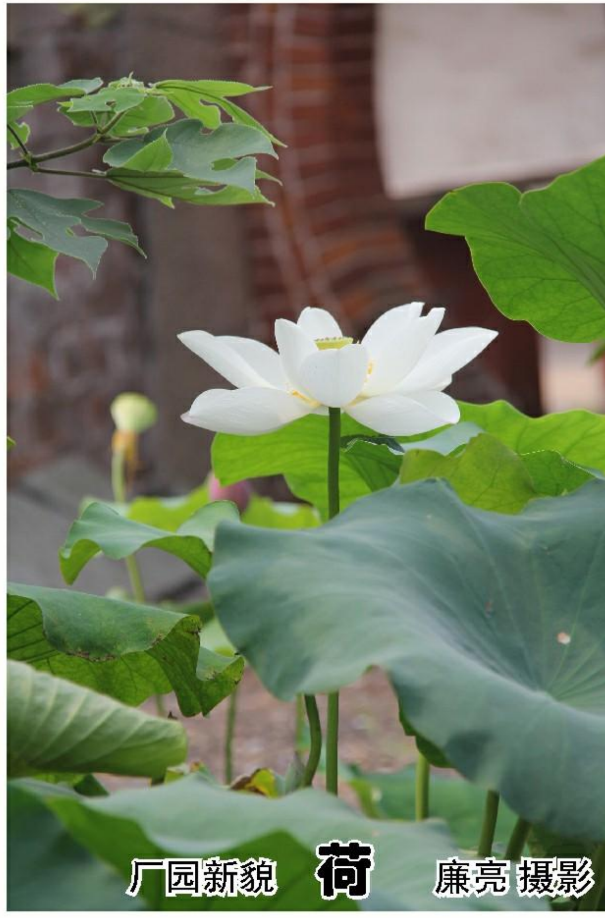
厂园新貌 荷 廉亮摄影

实习的第二个阶段是在水质检测中心。水质检测中心的工作,对于刚进部门不久我来说是一个全新的概念,水质化验很多项目是痕量分析,工作要求我们必须细致,每个环节都必须准确无误,这点都是与学校做的横向课题是不一样的。最初接触的项目是总磷、总氮的月报分析,由于对环境的不熟悉,开始做实验有些举步维艰,因而失败难以避免,但是经过反复思考,吸取经验教训,实验数据最终理想化。后面又学习了净水剂药剂相关指标的分析和硝酸盐氮含量等项目的测定。通过对水质分析项目的实验,使我感到做一件事情之前首先要想清楚为什么做以及怎样去实施,这样才能准确并高效率的完成,另外,提升思考能力是今后我要努力的方向。同时,也要从多方面努力摸索工作的方式、方法,积极锻炼自己的工作能力,力求尽快完成自身角色的转变,以崭新的姿态迎接新工作的挑战。