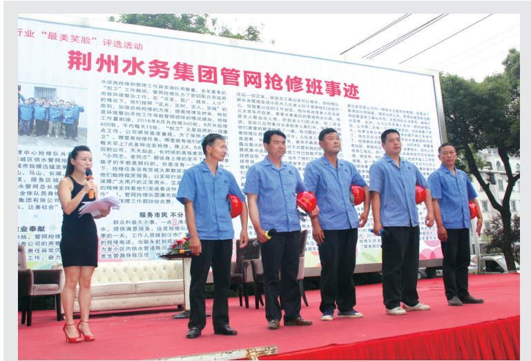
5月20日，管网管理中心抢修班代表荆州水务集团参加首届窗口行业“最美笑脸”评选启动活动。

荆州市内部资料准印证第36号 2017年6月9日 星期五 总第160期 地址：荆州市南湖路9号 电话：0716-4309982 E-mail:jsjtdqb@163.com